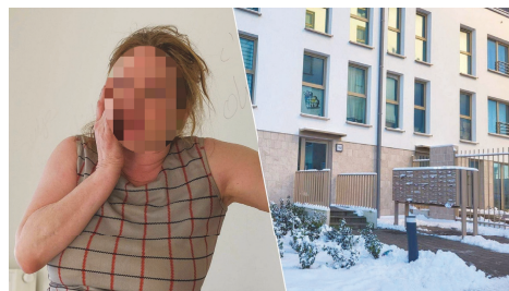
De buurvrouw van de jongen in dit appartementsblok is erg aangedaan over de feiten.